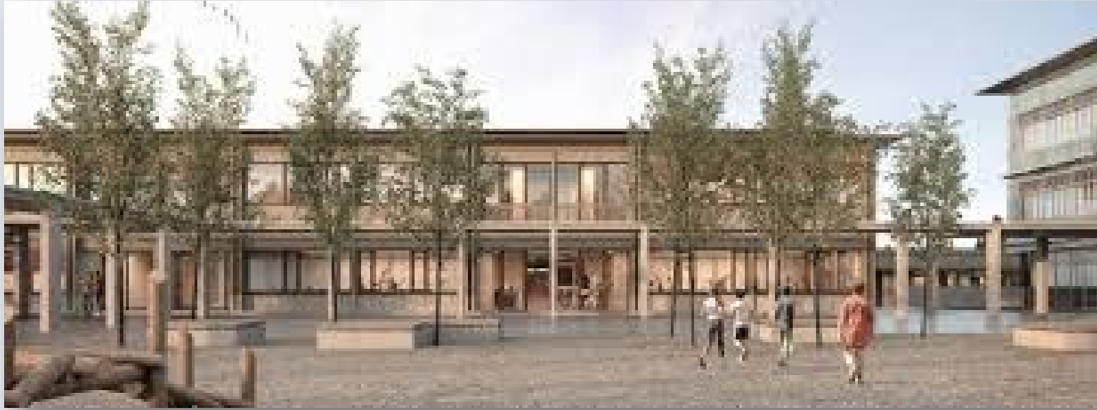
BASISSTUFE SCHULE ALTIKOFEN